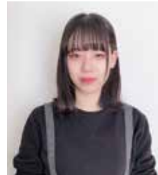
岩手県立盛岡第四高校 卒